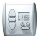
Horloge sans fil programmable pour volets roulants RTS