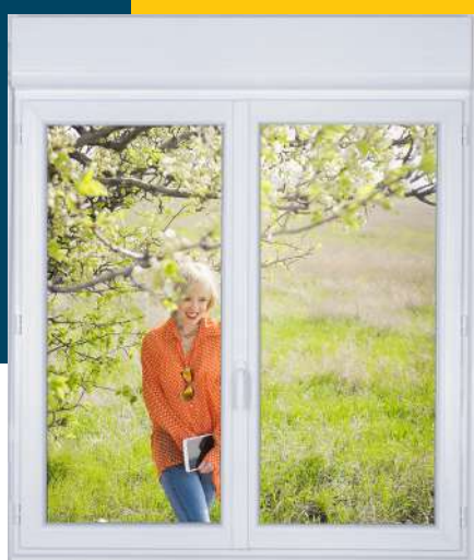
ECLIPSE VOLET ROULANT AVEC COFFRE INTÉRIEUR Logement neuf et rénovation