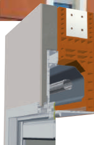
LINTÉA VOLET ROULANT DEMI-LINTEAU Logement neuf

Depuis 1923, OXXO propose des solutions innovantes et durables sur le marché de la menuiserie. L'usine OXXO, située au coeur de la Bourgogne dispose de moyens de production modernes permettant d'assurer la totalité des étapes de fabrication des menuiseries et fermetures OXXO..