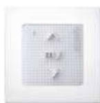
Commande murale Radio Smoove Origin RTS 3 boutons pour manoeuvrer votre volet roulant